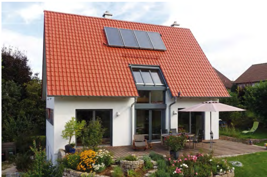
Klassisch fränkisch und doch modern: Lebensraum in Ellenbach

Es gibt Häuser, da komme ich hin und fühle mich wohl. Alles ist stimmig. Außen wie innen. Dabei war hier in Ellenbach der Hang eine Herausforderung, aber auch eine Chance. Hangsituationen schrecken