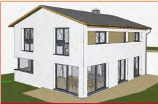
im Oktober: 90574 Roßtal