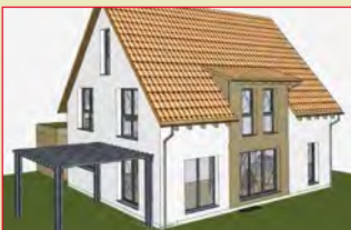
im Januar 2018: 90522 Oberasbach

Weitere Informationen zu diesen und weiteren Häusern, sowie deren aktuelle Montagetermine geben wir Ihnen rechtzeitig noch bekannt unter www.natuerlich-baubiologisch.de oder rufen Sie uns einfach an unter Tel. 09129 - 29 44 64.