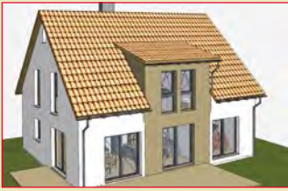
seit Anfang September: 90574 Roßtal