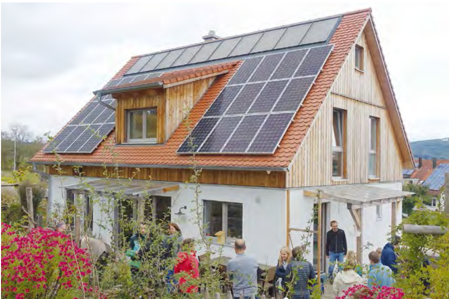
Zu Besuch am Walberla: Die Baufamilie hat uns eingeladen, das Haus mit der Hausrundfahrt zu besuchen.