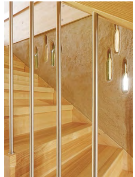
Das Abendlicht beleuchtet durch die eingeputzten Gläser die Treppe

Aus der Anfangsphase der Beratungszeit erinnere ich mich vor allem an das Lehmauseminar im Oktober 2011 in Trautskirchen, eine echte Ideenschmiede. Viele kommen dorthin, um zu lernen – unsere Baufamilie in Kirchehrenbach inspirierte die ganze Seminargruppe mit Ideen und viel Spaß am kreativen Experimentieren. Viel davon findet sich dann auch im Haus wieder, das mit liebevollen Details in der Gestaltung einladend und behaglich geworden ist. Dabei war es anfangs nicht einfach, den richtigen Platz zu finden. Mehrere Grundstücke haben wir begangen und die Bebaubarkeit geprüft. Der Bauplatz in Kirchehrenbach wurde es dann – obwohl der in zwei Richtungen scheinbar zur „falschen Seite“ fallende Hang die Vorstellung, wie es werden könnte, zuerst behindert hat. Heute sieht man, dass damals die richtigen Annahmen und Höheneinmessungen gelungen sind. Die Terrasse ist ebenerdig begehbar – genauso wie die Eingangsseite des Teilkellers. Dort „wohnt“ die Haustechnik und auf der gleichen Ebene neben dem Haus das Auto. Zum Walberla hin steigt der Hang durch mehrere Terrassen an, die zum Teil für Gemüseanbau genutzt werden. Ein Weidenpavillon spendet Schatten und auch Kinderspielbereich ist ausreichend berücksichtigt. Im