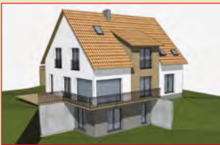
im November: 91077 Neunkirchen a. Br.