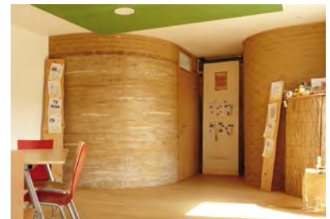
Arbeiten, wie andere wohnen dürfen: das Büro von natürlich-baubio-logisch in Wendelstein