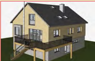
Aufstockung im November: 90556 Seukendorf