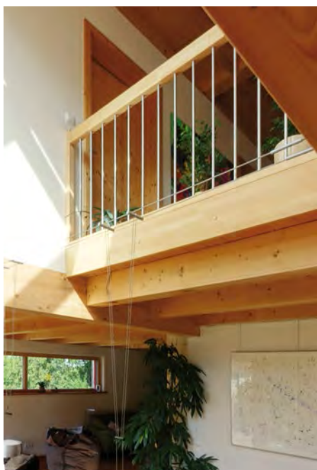
Offen und hell: die Galerie als verbindendes Element

Es gibt Häuser, da komme ich hin und fühle mich wohl. Alles ist stimmig. Außen wie innen. Dabei war hier in Ellenbach der Hang eine Herausforderung, aber auch eine Chance. Hangsituationen schrecken