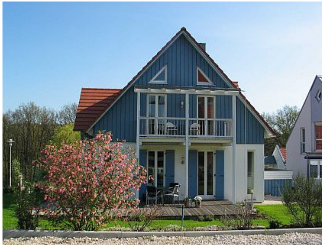
Ansicht vom Süden

Seit 1999 gibt es in 90587 Veitsbronn in der Caritas-Pirckheimer-Straße 8 ein HOLZBAUHAUS . Das Foto zeigt die Südseite.