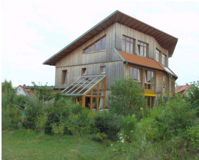
Ansicht vom Westen

Seit Mai 1996 gibt es in 90587 Veitsbronn in der Heide 43-47 ein HOLZBAUHAUS . Das Foto zeigt das Haus im Juli 2002.